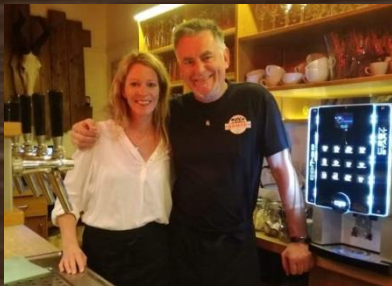
Ihr Farmer's Team

Wir hoffen dass Sie als unsere Gäste dies schätzen und bei vollem Lokal auch Verständniss dafür haben, wenn's mal ein paar Minuten länger dauert. Eine schöne Zeit in unserem Landgasthof wünscht Ihnen